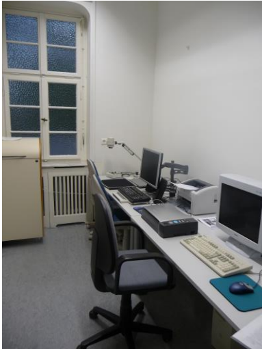
Raum 105 in der Zeppelinstr. 1

Der Arbeitsplatz ist mit entsprechender Hardware (Scanner, Braillezeile etc.) und Software (JAWS, Zoomtext etc.) ausgestattet.