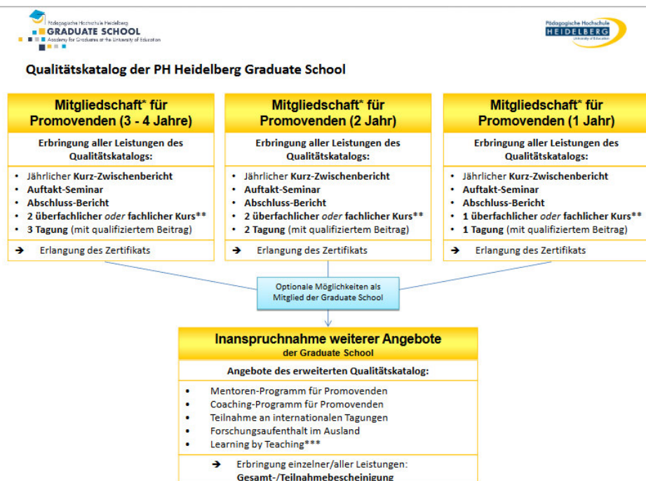
Abb. Qualitätskatalog der PH Heidelberg Graduate School

Die PH Heidelberg Graduate School hat für ihre Mitglieder einen verpflichtenden Qualitätskatalog erstellt, der verschiedene Bereiche wie Teilnahme an Kursen oder nationalen / internationalen Tagungen vorsieht (vgl. Flindt/Oberländer 2016).