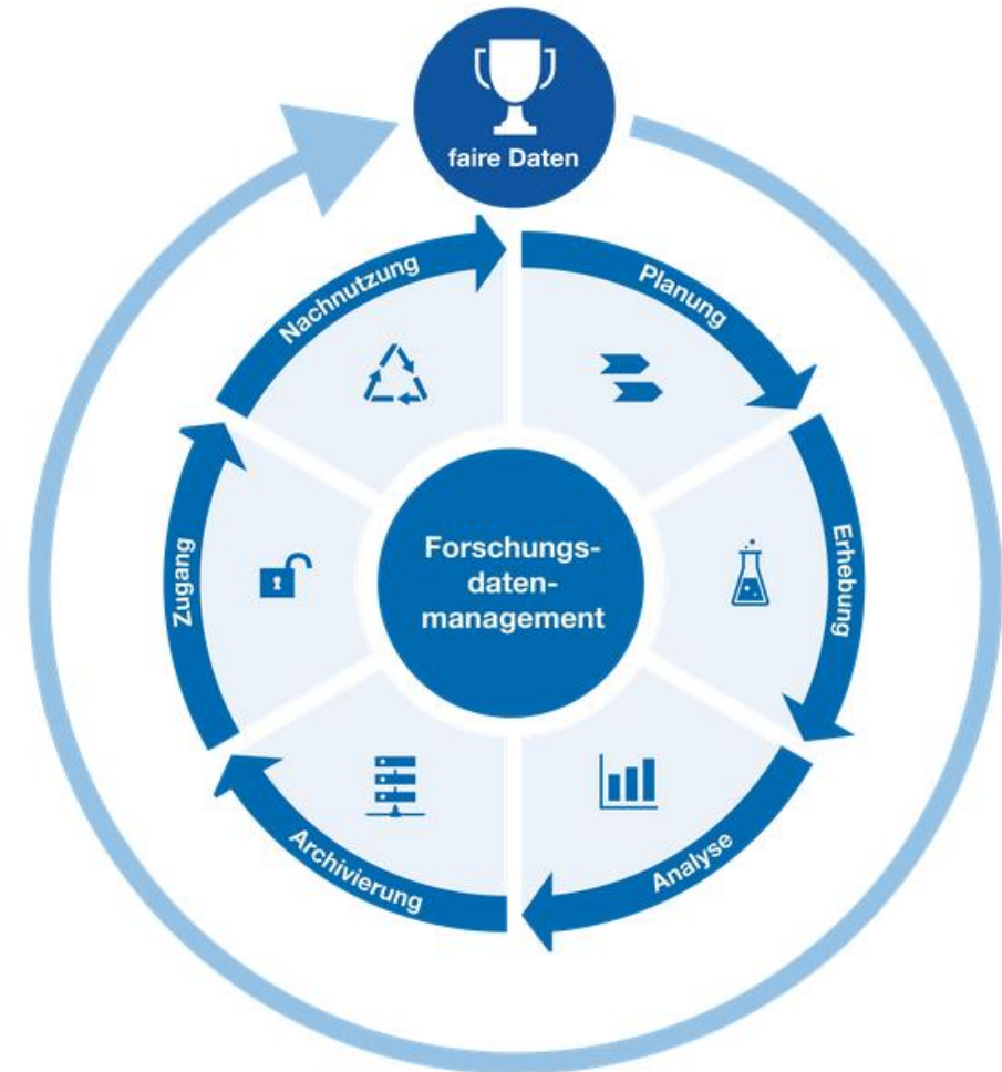
Abb.: Der Datenlebenszyklus 1