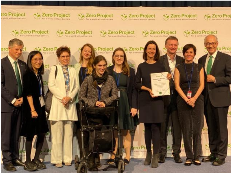
Award „Innovative Practice“, Februar 2020, Wien